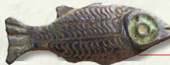
Broche en forme de poisson datant des 1 er -2 e siècles