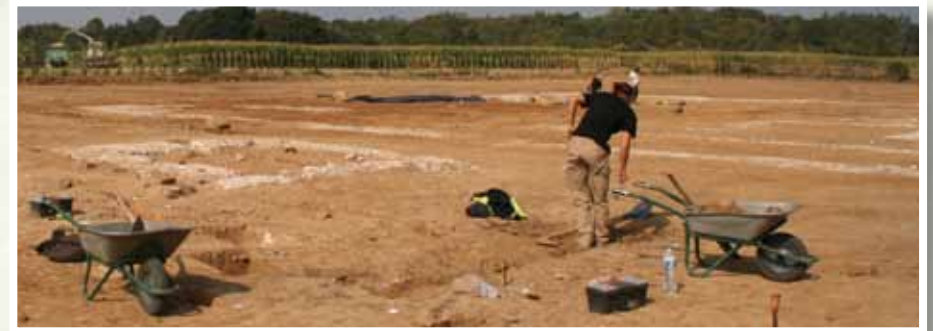
A gauche, un des petits édifices carrés découvert à l'extérieur de l'enceinte sacrée