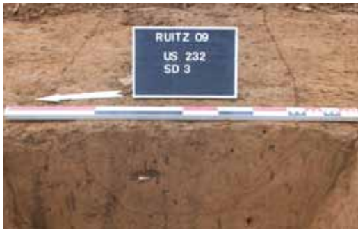
Coupe d'un des fossés

Dans un premier temps, le site de Ruitz a accueilli une zone d'habitation, au tout début de l'époque gallo-romaine (première moitié du 1 er siècle). En effet, un réseau de fossés partiellement conservé et très perturbé par des transformations ultérieures suggère une activité liée à l'habitat.