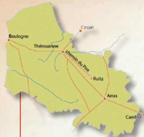
Carte des voies romaines connues au 1 er siècle

Ruitz s'inscrivait dans un territoire dynamique par le rayonnement de l'important centre de production de céramiques de Labuissière. Ces ateliers ont amené une installation de populations, ainsi qu'une organisation économique impactant les territoires voisins. Il n'est donc pas étonnant qu'une villa gallo-romaine et qu'un pôle funéraire du début du 1 er siècle se soient implantés à proximité.