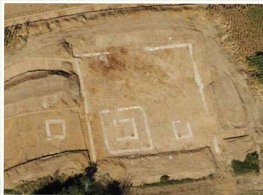
Vue aérienne du site de Ruitz

Le Conseil général du Pas-de-Calais prévoit l'aménagement de la déviation Béthune/Bruay-la-Buissière. Sur la base des prescriptions de l'Etat, une dizaine d'archéologues du Centre départemental d'Archéologie est intervenue de septembre à novembre 2009 pour fouiller des vestiges présents sur une partie du futur tronçon, un promontoire dominant la vallée à 80 mètres d'altitude.