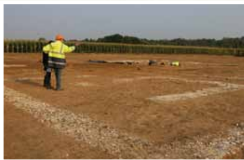
Vue générale du fanum , temple gallo-romain à plan carré

Mais la découverte majeure est d'ordre culturel. Un temple gallo-romain ( fanum ), inspiré des lieux de culte gaulois a été édifié au début du 2 e siècle, à proximité de la frontière des territoires de deux tribus gallo-romaines : les Atrébates et les Morins.